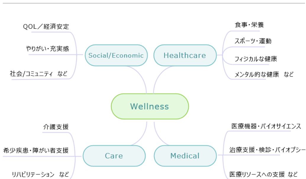
投資対象領域（ウェルネス領域での4領域）

TWIF はウェルネスを投資対象領域としています。ウェルネスとは、身体的、精神的、社会的に健康で安心な状態（Global wellness Institute : GWI, 2015）であると定義されていることから、具体的には、以下の4つの領域における国内の課題解決を図るスタートアップへ投資します。